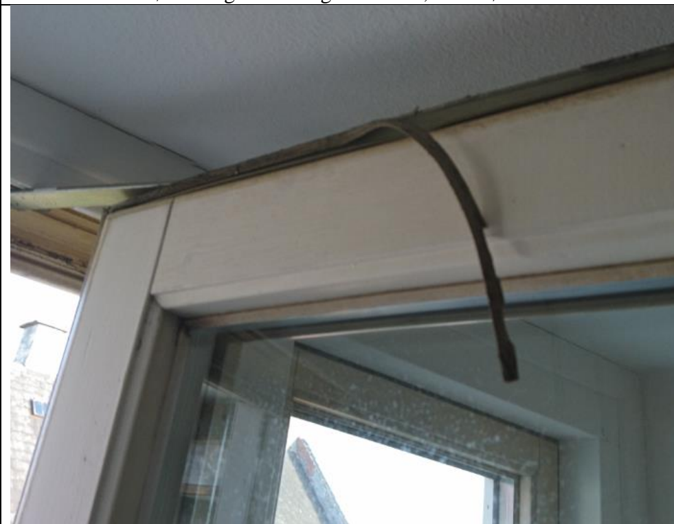
Billede af defekt tætning gummiliste