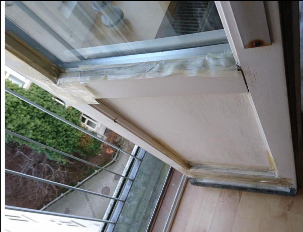
Billede af altandør mod gård der fuges. nr. 114, 4.sal dør 1.