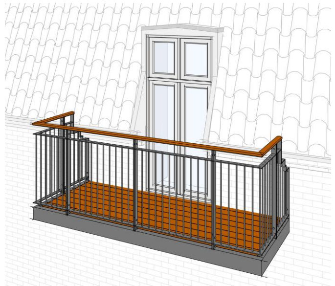
Principskitse af tiltænkt altan

Der monteres 1 stk. nyt nedløb, som føres til terræn (tilsluttes ikke kloak)