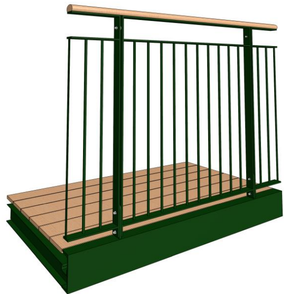
Skitse af tiltænkt altan

Altanbunden er integreret med indvendige afvandingsplader som afslutter ved forkant af altanen mellem bundrammen og underpladen.